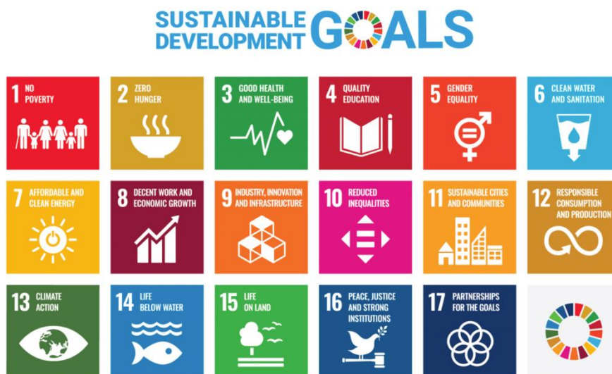
แผนภาพที่ 2 แสดง Sustainable Development Goals: SDGs

เป้าหมายการพัฒนาที่ยั่งยืน (Sustainable Development Goals: SDGs) มีทั้งหมด 17 เป้าหมาย (Goals) ภายใต้หนึ่งเป้าหมายจะประกอบไปด้วยเป้าหมายย่อย ๆ ที่เรียกว่า เป้าหมายย่อย (Targets) ซึ่งมีจำนวนทั้งหมด 169 เป้าหมายย่อย และพัฒนา ตัวชี้วัด (Indicators) จำนวน 232 ตัวชี้วัด (ทั้งหมด 244 ตัวชี้วัดแต่มีตัวที่ซ้ำ 12 ตัว) เพื่อติดตามความก้าวหน้าของเป้าหมายย่อยดังกล่าว