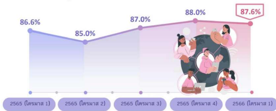
แผนภาพที่ 2 : สถิติการใช้อินเทอร์เน็ตของประเทศไทย ตั้งแต่ปี พ.ศ. 2565 (ไตรมาส 1) - 2566 (ไตรมาส 1) ที่มา : สรุปผลที่สำคัญ สํารวจการมีกรใช้เทคโนโลยีสารสนเทศและการสื่อสารในครัวเรือน พ.ศ. 2566 ของสำนักงานสถิติแห่งชาติ

การเปลี่ยนผ่านสู่ยุคดิจิทัล ด้วยการพัฒนาเทคโนโลยีสารสนเทศและการสื่อสาร โดยประชากรวัยเรียนส่วนใหญ่จะเป็นกลุ่มประชากร Generation Z หรือ Gen Z (ผู้ที่เกิดระหว่างปี พ.ศ. 2539 - 2553) ที่ดำเนินชีวิตประจำวันพร้อมกับสิ่งอำนวยความสะดวกและเทคโนโลยีต่าง ๆ ที่จะทำให้สามารถเข้าถึง สื่อสังคมออนไลน์ได้ง่ายยิ่งขึ้น ซึ่งมีอิทธิพลต่อการเรียนรู้รูปแบบใหม่ เช่น ระบบการเรียนรู้แบบเคลื่อนที่ ผ่านโทรศัพท์มือถือ (Mobile Learning) การเรียนรู้ในระยะเวลาสั้น ๆ ที่มีเนื้อหากระชับและตรงประเด็น (Micro-Learning) การเรียนผ่านสื่อวีดิทัศน์ (Video-Based Learning) และการเรียนรู้ที่ขับเคลื่อนด้วยเกม (Gamification) เป็นต้น อย่างไรก็ตาม ในปัจจุบันประชาชนส่วนใหญ่สามารถเข้าถึงอินเทอร์เน็ตได้อย่างทั่วถึงมากขึ้น จึงมีช่องทางในการแสวงหาความรู้ที่เปิดกว้างมากยิ่งขึ้น 6 เมื่อพิจารณาจากสถิติการใช้อินเทอร์เน็ตของประชาชนอายุ 6 ปีขึ้นไป ตั้งแต่ปี พ.ศ. 2565 (ไตรมาส 1) - 2566 (ไตรมาส 1) จะเห็นได้ว่า อัตราการเข้าถึงและการใช้อินเทอร์เน็ต ของประเทศไทยมีอัตราที่เพิ่มสูงขึ้น รายละเอียดดังภาพต่อไปนี้ 7