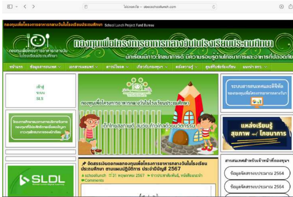
แผนภาพที่ 3 : กองทุนเพื่อโครงการอาหารกลางวันในโรงเรียนประถมศึกษา